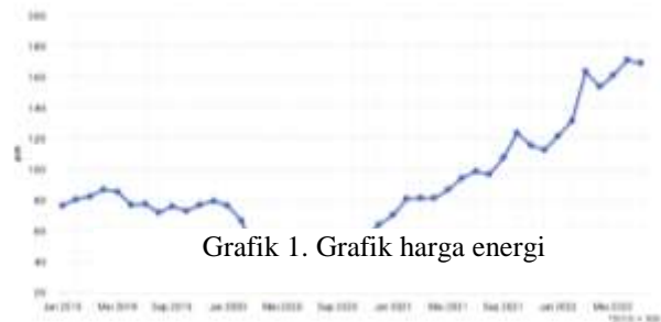
Grafik 1. Grafik harga energi

Sedangkan pada Grafik2 konservatisme akuntansi menunjukkan nilai yang cenderung fluktuatif. Konservatisme akuntansi tertinggi