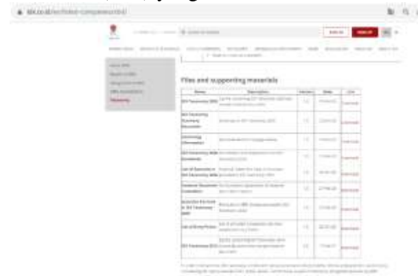
Gambar 1. Halaman XBRL di Bursa Efek Indonesia

Hasil ini tidak sesuai dengan studi yang dilakukan oleh (Mousa, 2010) menyatakan kesulitan dalam menciptakan perangkat lunak yang kompatibel dengan XBRL telah dianggap sebagai teknologi pelaporan yang mahal, yang mengakibatkan beban administratif tambahan pada pengguna tanpa manfaat tambahan bagi bisnis. Seperti disebutkan sebelumnya, bahwa Bursa Efek Indonesia juga sudah menyediakan fasilitas untuk penggunaan XBRL. Berikut tampilan halaman di website Bursa Efek Indonesia (BEI) yang memfasilitasi XBRL.