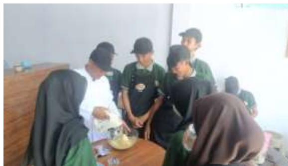
Gambar 4. Proses membuat cake

Peserta praktik membuat aneka cake yaitu di pertemuan pertama membuat cake marmer dan pelatihan kedua membuat bolu gulung. Cake marmer dan bolu tape adalah cake dengan metode creaming dan mempunyai tekstur padat tetapi moist.