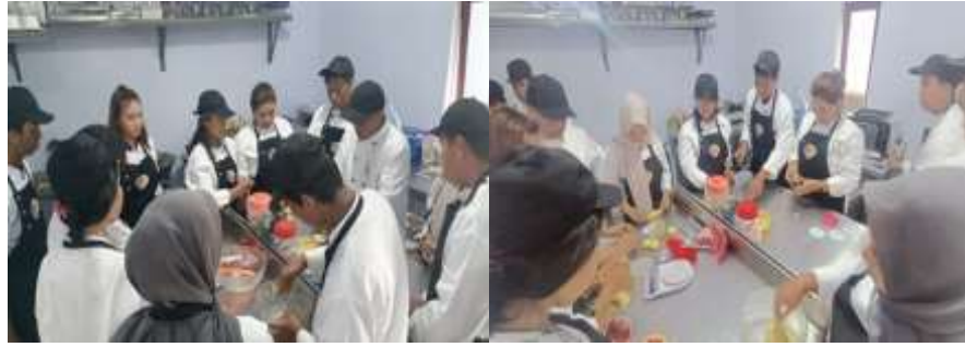
Gambar 2. Membuat roti manis