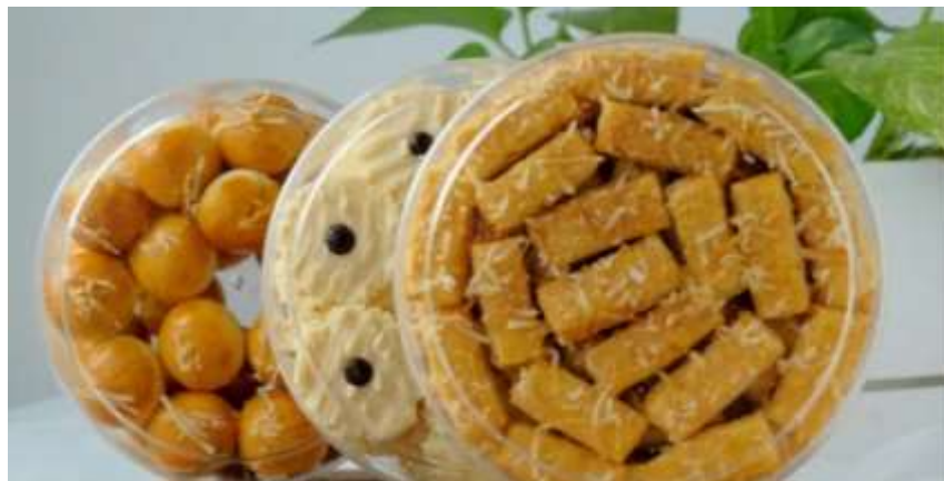
Gambar 9. Pengemasan produk

Peserta yang bisa menentukan BEP menandakan bahwa peserta dapat memprediksi sebanyak apa dan selama apa peserta akan menjual produknya. Peserta juga diberikan contoh tentang kemasan terutama dalam mengemas kue kering yaitu seperti kemasan kue, roti serta memilih toples yang sesuai untuk mengemas kue kering.