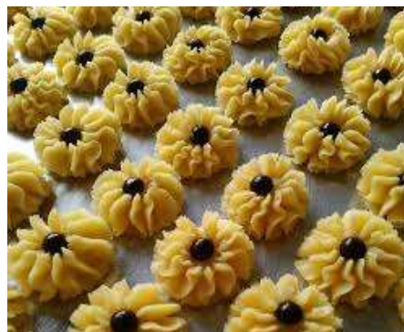
Gambar 7. Membuat Kue Kering

Peserta membuat aneka jenis kue kering. Kue kering adalah salah satu kue yang digemari banyak orang, sajian khas dari hari raya maupun sajian keluarga di rumah. Kue kering yang dipraktikkan yaitu chococip cookies di hari pertama dan cheese almond cookies dihari kedua dengan tujuan saat hari-hari besar peserta bisa membuat produk kue kering untuk dijual. Proses pembuatan dimulai dengan peserta menimbang bahan dan menyiapkan peralatan. Membuat produk kue kering, mencetak dan memanggang kue kering.