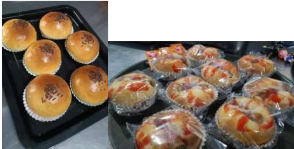
Gambar 3. Produk Roti Manis