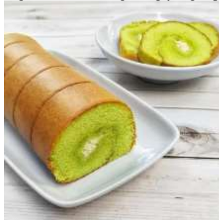
Gambar 6. Bolu Gulung

Peserta dihari pertama praktik membuat chipffon dan hari kedua membuat aneka bolu gulung. Proses pembuatan cake dengan tingkatan yang lebih tinggi dan terkadang mengalami beberapa kegagalan oleh peserta seperti tidak bisa menggulung, cake bantat dan cake tidak mengembang. Peserta diberikan pelatihan bagaimana cara membuat cake dengan metode sponge yang benar, suhu oven yang sesuai dan praktik mengisi selai dan menggulung bolu supaya menghasilkan bolu fgulung yang rapi.