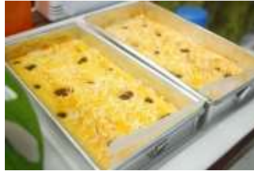
Gambar 5. Produk Bolu Tape