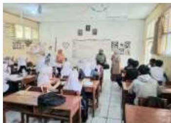
Gambar 3. Diskusi Bersama Guru dan Siswa.

Setelah observasi, dilakukan survei analisis kebutuhan yang disajikan pada gambar 2 di salah satu kelas VIII dengan jumlah responden sebanyak 36 siswa. Survei dilakukan saat jam istirahat dan berkaitan dengan kebutuhan pelatihan. Hasil wawancara menunjukkan bahwa pelatihan serupa pernah dilakukan pada angkatan tahun 2022, namun siswa angkatan saat ini belum pernah mengikuti pelatihan tersebut sehingga belum mengenal dan menggunakan PhET Simulation secara optimal.