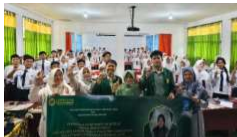
Gambar 10. Sesi dokumentasi dan penutupan

Setelah sesi simulasi selesai, siswa mengerjakan post-test yang berisi soal serupa dengan pre-test namun telah disesuaikan untuk menilai peningkatan pemahaman mereka (seperti terlihat pada gambar 9). Setelah pelaksanaan post-test, kegiatan dilanjutkan dengan sesi dokumentasi, yang ditampilkan pada gambar 10 di bawah ini: