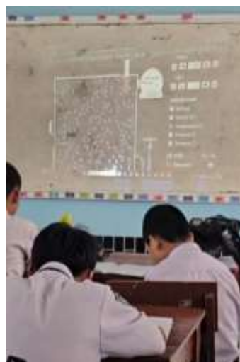
Gambar 8. Penjelasan teori kinetik gas dengan PhET simulation

Pre-test berisi soal-soal literasi dan numerasi. Soal literasi sains disusun untuk menilai kemampuan siswa dalam memahami teks ilmiah serta membaca informasi visual, sedangkan soal numerasi digunakan untuk mengukur keterampilan perhitungan dan kemampuan menginterpretasi data kuantitatif. Setelah tahap ini, kegiatan berlanjut ke sesi pelatihan menggunakan PhET Simulation, seperti ditunjukkan pada gambar 8 berikut: