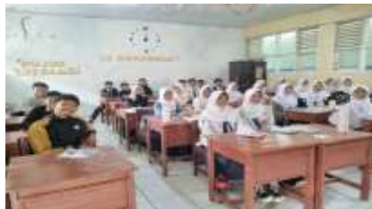
Gambar 2. Survei Awal Analisis Kebutuhan di Kelas.

Pada gambar 1 merupakan kegiatan persiapan P2M yaitu melakukan observasi langsung ke SMPN 1 Cipanas. Tujuan dari observasi dilakukan untuk mengamati situasi dan kondisi di SMPN 1 Cipanas. Observasi juga dilakukan dengan berdiskusi antara pengabdian, guru IPA dan kepala sekolah dalam melakukan perjanjian mitra P2M.