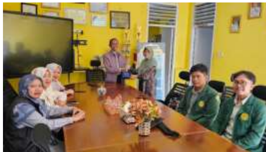
Gambar 5. Penyerahan plakat kepada kepala sekolah SMPN 1 Cipanas

Pada tahap persiapan, tim dosen dan mahasiswa dari institusi pelaksana melakukan berbagai langkah awal, termasuk berkoordinasi dengan pihak sekolah, menata ruangan, serta memeriksa kesiapan perangkat pembelajaran digital seperti proyektor, laptop, dan jaringan internet. Kegiatan dibuka secara resmi melalui sambutan dari kepala sekolah SMPN 1 Cipanas dan ketua tim pelaksana. Setelah itu, acara dilanjutkan dengan penyerahan cendera mata kepada pihak sekolah, sebagaimana ditunjukkan pada gambar 5 berikut: