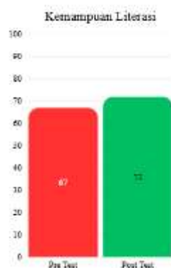
Gambar 11a. Rata-rata kemampuan literasi

Sesi dokumentasi ini menjadi tahap akhir dari rangkaian kegiatan pengabdian kepada masyarakat. Dokumentasi kegiatan disajikan dalam bentuk video ringkasan yang memuat cuplikan pelaksanaan pelatihan serta penjelasan tambahan, dan dapat diakses melalui tautan berikut: https://youtu.be/1Bi8V3EP5hI . Video tersebut digunakan sebagai data pendukung untuk memberikan gambaran umum terkait implementasi kegiatan di lapangan. Selanjutnya, gambar 11 di bawah ini menampilkan hasil pre-test dan post-test terkait kemampuan literasi dan numerasi siswa: