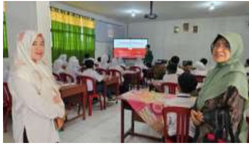
Gambar 6. Pemberian materi teori kinetik gas berbasis STEM dengan PowerPoint

Materi disajikan menggunakan media PowerPoint yang mengintegrasikan unsur sains, teknologi, rekayasa, dan matematika . Dalam proses penyampaian, dosen menekankan pemahaman mengenai konsep partikel gas, keterkaitan antara suhu dan energi kinetik, serta penerapannya dalam kehidupan sehari-hari. Setelah itu, dilakukan pre-test untuk mengukur kemampuan awal siswa dalam memahami materi tersebut, sebagaimana ditunjukkan pada gambar 7: