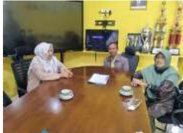
Gambar 1. Diskusi dengan Guru IPA dan Kepala Sekolah

Berdasarkan hasil observasi langsung di SMPN 1 Cipanas, diperoleh temuan bahwa sekolah tersebut belum pernah melaksanakan pelatihan media pembelajaran fisika berbasis STEM menggunakan PhET Simulation. Selain itu, siswa belum mahir menggunakan PhET Simulation pada materi teori kinetik gas, serta belum pernah dilakukan pengukuran kemampuan literasi dan numerasi pada materi tersebut. Oleh karena itu, kegiatan pengabdian kepada masyarakat berupa Pelatihan Media Pembelajaran Fisika Berbasis STEM Menggunakan PhET Simulation dinilai sangat diperlukan untuk meningkatkan kualitas pembelajaran serta kemampuan literasi dan numerasi siswa di SMPN 1 Cipanas. Bukti hasil observasi langsung disajikan pada Gambar 1.