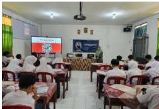
Gambar 7. Pre-test tentang teori kinetik gas

Materi disajikan menggunakan media PowerPoint yang mengintegrasikan unsur sains, teknologi, rekayasa, dan matematika . Dalam proses penyampaian, dosen menekankan pemahaman mengenai konsep partikel gas, keterkaitan antara suhu dan energi kinetik, serta penerapannya dalam kehidupan sehari-hari. Setelah itu, dilakukan pre-test untuk mengukur kemampuan awal siswa dalam memahami materi tersebut, sebagaimana ditunjukkan pada gambar 7: