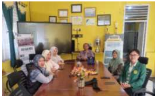
Gambar 4. Persiapan pelatihan

Kegiatan pengabdian kepada masyarakat ini dilaksanakan pada hari Selasa, 07 April 2026, berlokasi di SMP Negeri 1 Cipanas. Kegiatan tersebut diikuti oleh 75 siswa kelas VIII yang dipilih sebagai peserta pelatihan. Fokus utamanya adalah memberikan pelatihan penggunaan media pembelajaran fisika berbasis STEM ( Science, Technology, Engineering, and Mathematics ) melalui PhET Simulation untuk meningkatkan kemampuan literasi dan numerasi siswa, terutama pada materi teori kinetik gas. Seluruh rangkaian dimulai dengan tahap persiapan, sebagaimana ditunjukkan pada gambar 4 berikut: