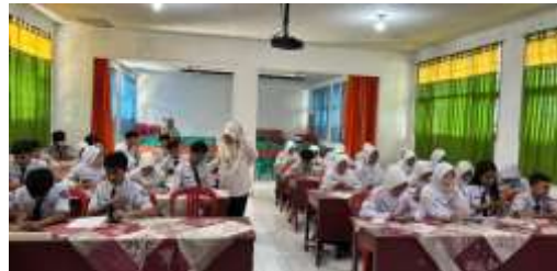
Gambar 9. Post test materi teori kinetik gas

Melalui simulasi ini, siswa diajak untuk secara langsung mengeksplorasi pergerakan partikel gas pada berbagai kondisi suhu dan volume. Pemanfaatan PhET Simulation diawali dengan demonstrasi oleh mahasiswa, kemudian dilanjutkan dengan kegiatan eksperimen mandiri oleh siswa yang tetap didampingi oleh tim pelaksana. Siswa terlihat antusias dalam mencoba beragam fitur yang tersedia serta mencatat perubahan yang terjadi pada sistem gas. Pendekatan berbasis STEM ini mempermudah siswa dalam memahami konsep fisika yang bersifat abstrak melalui visualisasi, pemodelan, serta analisis data yang dapat dimanipulasi secara real time.