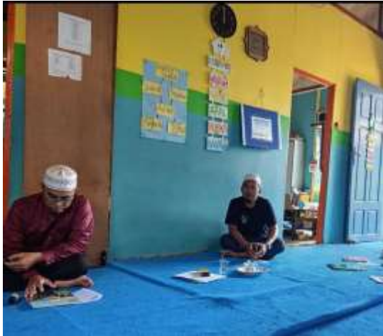
Kata Sambutan dari Pihak Sekolah

(1) urgensi pemahaman dan pemenuhan standar kompetensi pendidik di homeschooling, dan (2) pentingnya ketersediaan sarana pendukung yang menunjang proses belajar aktif, mandiri, dan menyenangkan. Materi dikembangkan berdasarkan Permendikbud Nomor 16 Tahun 2007 serta Undang-Undang Nomor 20 Tahun 2003 tentang Sistem Pendidikan Nasional, dan diperkuat oleh pandangan para pakar seperti Fullan (2019) dan Hattie (2021).