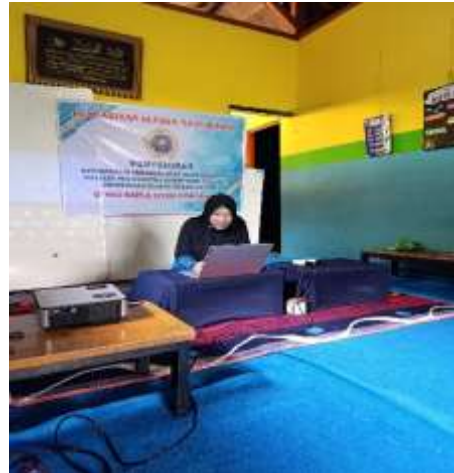
Kata Sambutan Ketua Pelaksana