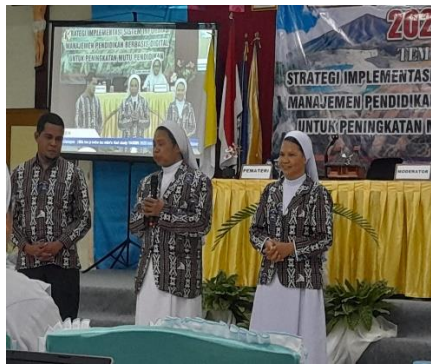
Foto pemberi materi