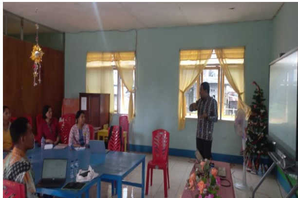
Penyajian Materi Konsep