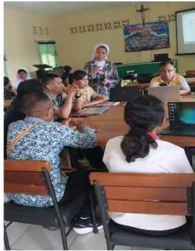
Foto Peserta Pelatihan