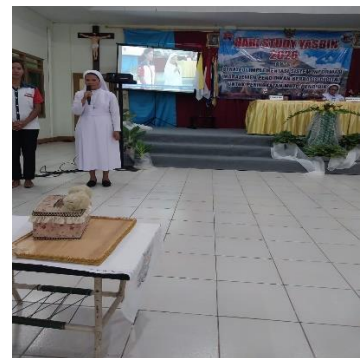
Foto Penyajian Materi