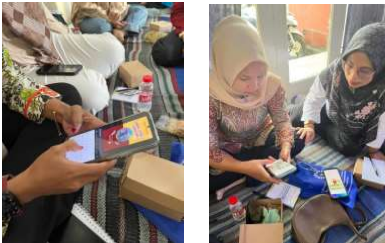
Gambar 1. Praktik Pembuatan Video Produk oleh Peserta Pelatihan

Tahap inti kegiatan berupa pelatihan praktik pembuatan video produk menggunakan telepon genggam. Materi pelatihan mencakup teknik pengambilan gambar, seperti penentuan sudut pengambilan ( angle ), pengaturan pencahayaan, dan komposisi visual, perekaman video produk secara sederhana, penyusunan alur atau konsep video promosi, serta penyuntingan dasar menggunakan aplikasi yang mudah diakses dan ramah bagi pemula. Selain aspek visual, peserta juga dilatih menyusun narasi promosi ( caption ) yang singkat dan persuasif untuk mendukung unggahan video pada berbagai platform daring yang ada.