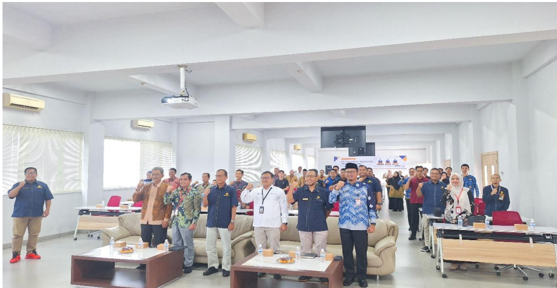
Gambar 2. Foto Bersama pada Awal Kegiatan Diseminasi KFR

Selanjutnya, kegiatan dibuka secara resmi melalui keynote speech yang disampaikan oleh Prof. Setiawan Assegaff, ST, MMSI, Ph.D selaku Rektor Universitas Dinamika Bangsa. Dalam sambutannya, Rektor menekankan pentingnya peran perguruan tinggi sebagai mitra strategis pemerintah dalam penyebaran informasi kebijakan fiskal serta peningkatan literasi fiskal di kalangan civitas akademika dan masyarakat luas. Sesi pembukaan ini menjadi landasan konseptual bagi peserta sebelum memasuki pemaparan materi utama.