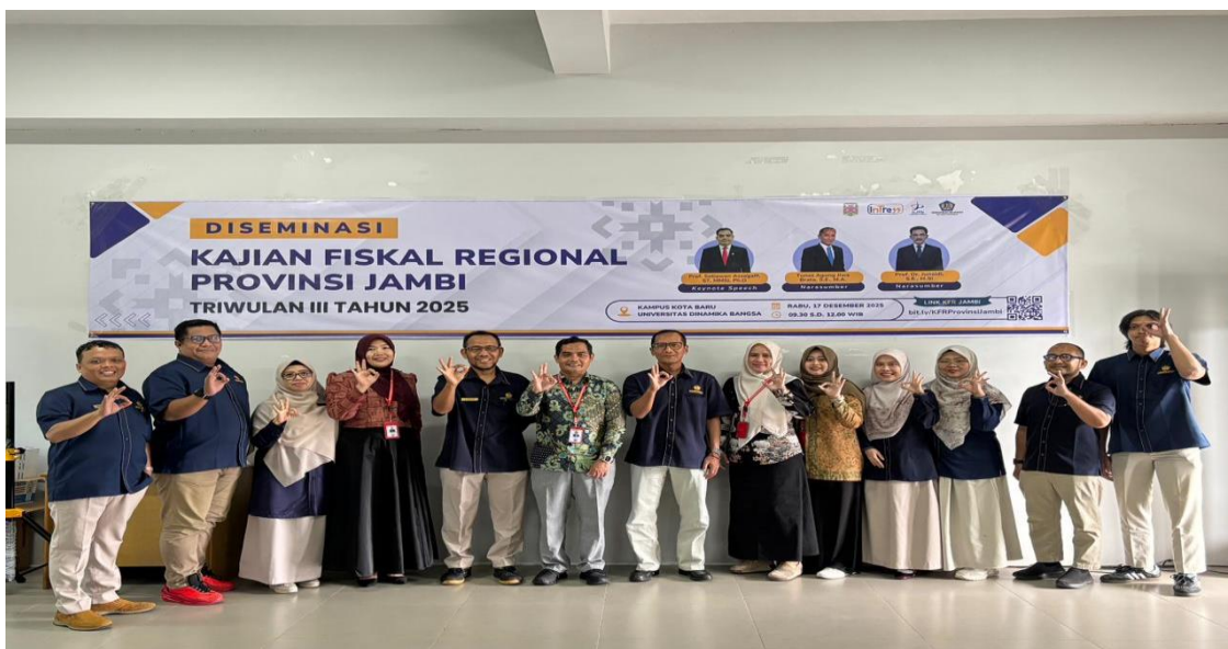
Gambar 7. Foto Bersama Panitia Diseminasi KFR

Sebagai penutup rangkaian kegiatan dan bagian dari tahap evaluasi, dilakukan sesi dokumentasi akhir melalui foto bersama seluruh panitia, yakni perwakilan dari Universitas Dinamika Bangsa dan Kanwil DJPb Provinsi Jambi. Kegiatan ini merefleksikan keberhasilan pelaksanaan Diseminasi KFR serta komitmen berkelanjutan dalam memperkuat sinergi antara perguruan tinggi dan pemerintah dalam meningkatkan literasi fiskal di Provinsi Jambi.