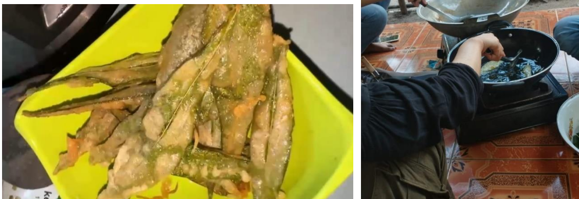
Gambar 3. Sosialisasi Produk Keripik Daun Singkong