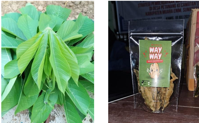
Gambar 4. Daun Singkong dan Keripik Daun Singkong

Jenis Produk yang Dikembangkan yaitu Daun Singkong Menjadi Keripik Daun Singkong. Masyarakat juga harus berhasil mengembangkan keripik dari daun singkong yang memiliki tekstur renyah dan rasa gurih. Produk ini dibuat melalui proses penggorengan setelah daun singkong dilumuri campuran bumbu khusus. Keripik ini pasti disukai oleh konsumen sekitar dan dikenal sebagai makanan ringan khas Desa Petanang.