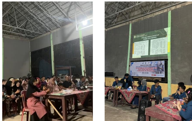
Gambar 5. Sosialisasi Produk Lokal Baru di Gedung Serbaguna Desa Petanang