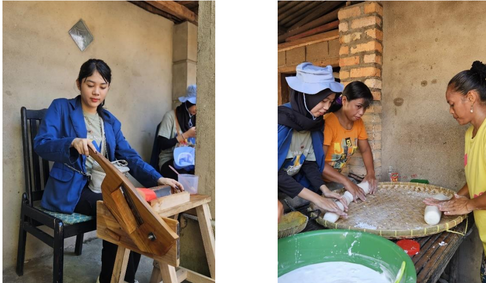
Gambar 2. Survei Produk Lokal Desa Petanang