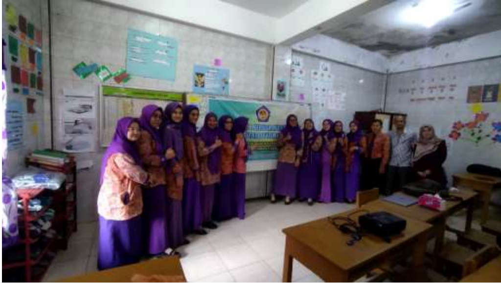
Gambar 3. Selesai Sesi Pemaparan Pembuatan Website Sebagai Media Informasi dan Promosi di Sekolah SD IT Hikmatul Fahillah – Medan Bersama Mitra Kepala Sekolah, Guru-guru dan Para Administrasi Sekolah Sekolah