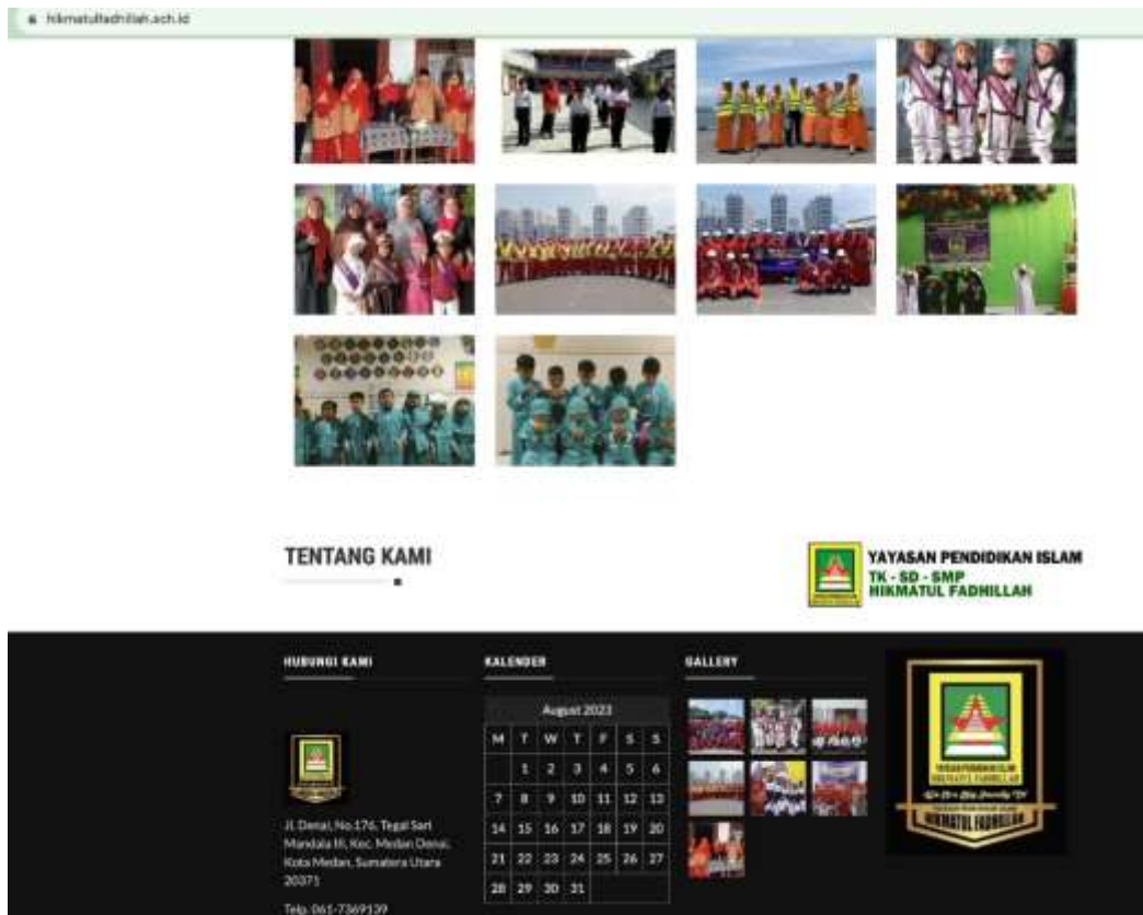
Gambar 4. Web yang dirancang untuk membantu Mitra Sebagai Media Informasi dan Promosi di Sekolah SD IT Hikmatul Fahillah