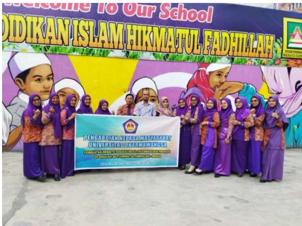
Gambar 2. Selesai Sesi Pemaparan Pembuatan Website Sebagai Media Informasi dan Promosi di Sekolah SD IT Hikmatul Fahillah – Medan Bersama Mitra Kepala Sekolah, Guru-guru dan Para Adminstrasi