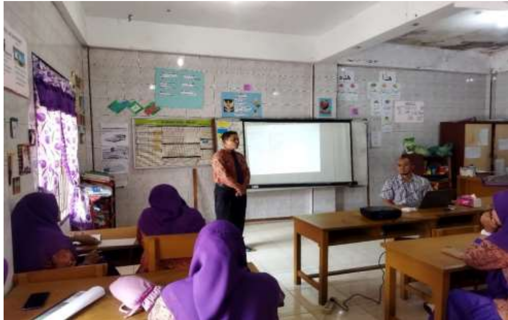
Gambar.1. Kata Sambutan dari Kepala Sekolah SD IT Hikmatul Fadhillah Setelah Selesai Pemaparan Pembuatan Website Sebagai Media Informasi dan Promosi